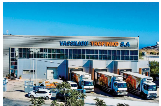
Υποκατάστημα Κρήτης / Crete branch office